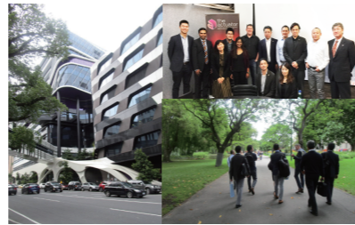
平成30年度 オーストラリア・メルボルンミッション